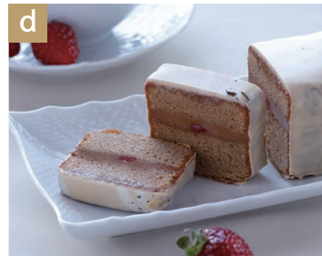
Strawberry Royal Milk Tea 苺ロイヤルミルクティー