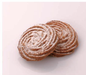
Sablé sirop d'érable