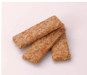
Sablé au sésame