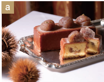
Cake au marron ケーキ・オ・マロン