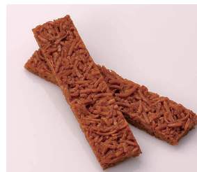
Tuiles à la noix de coco