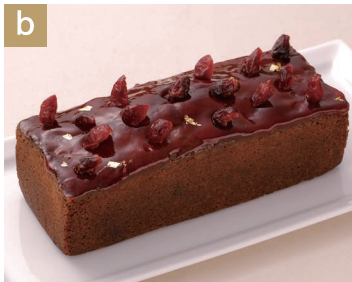
Cake aux fruits rouge ケーキ・オ・フリュイ・ルージュ